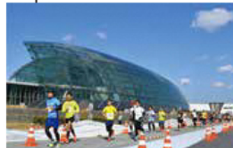
アクアマリンパーク 環境水族館「アクアマリンふくしま」や、いわき市観光物産センター「いわき・ら・ら・ミュウ」など、海のまち・いわきを代表する観光スポット。