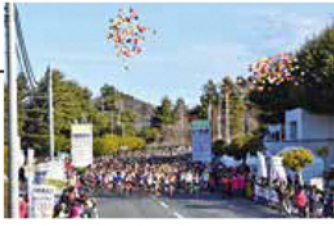
いわき陸上競技場 マラソンスタート会場