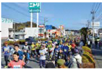
鹿島街道 レース序盤の緩やかな下り坂。飛ばしすぎ注意!