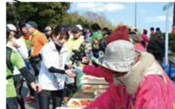
マリナータワー下 地元の食材を振る舞う「特産物エイド」!