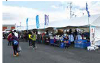
ゴール会場 地元物産展、スポーツ用品グッズ販売ブースなどがあります。