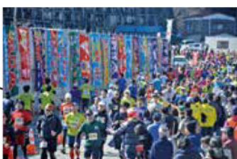
江名港 いわきサンシャインマラソンといえば! 江名港の大漁旗!