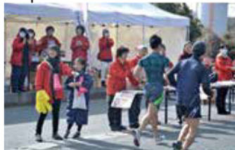
日産いわき工場付近 レース後半、皆さんの背中を後押しします!